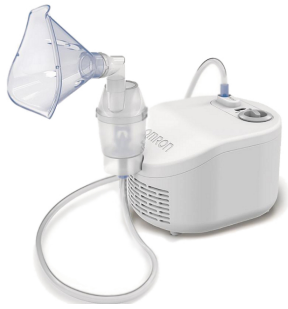
-Omron Nami Cat